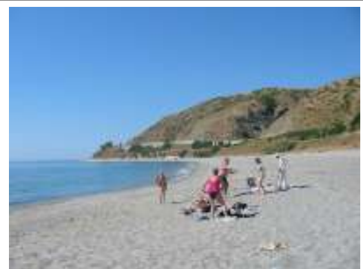
bagno a Capo Bruzzano