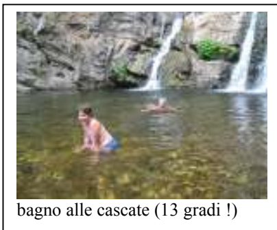
bagno alle cascate (13 gradi !)

19/06: trasferimento in località Cerasia . Escursione alle Cascate Forgiarelle e Palmarello due delle cascate più belle e più alte del Parco Nazionale d'Aspromonte che si gettano con un unico salto di circa 70 m. Il tratto di sentiero che si snoda nella zona più interna e nascosta del Parco segue il crinale, dove si incontrano querce monumentali ed ampi tappeti di ginepro. Cena e pernottamento al rifugio " Biancospino ". Difficoltà: E - Durata: 7 ore