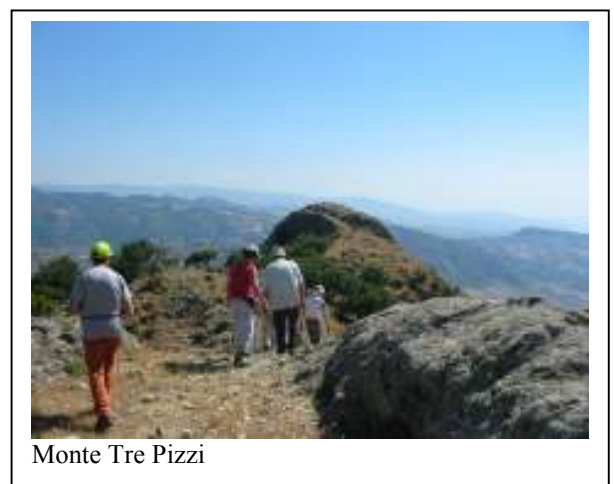
Monte Tre Pizzi

Cena e pernottamento in agriturismo " A Sena Runcatini ". Difficoltà: E - Durata: 4 ore